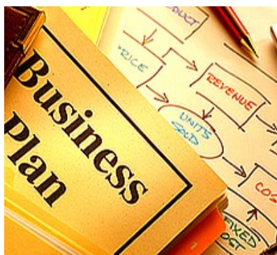
Business plan competition

'Vulcanica-Mente', una "business plan competition" per far emergere 20 progetti ad alto tasso d'innovazione. Saranno inseriti nei percorsi di incubazione del Centro servizi di Napoli est